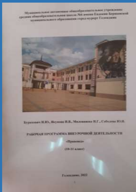
Рабочая программа внеурочной деятельности «Правознайка», 2022 г.