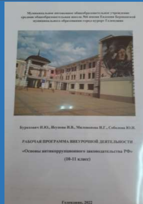
Рабочая программа внеурочной деятельности «Основы анти- коррупционного законодательства РФ», 2022г.